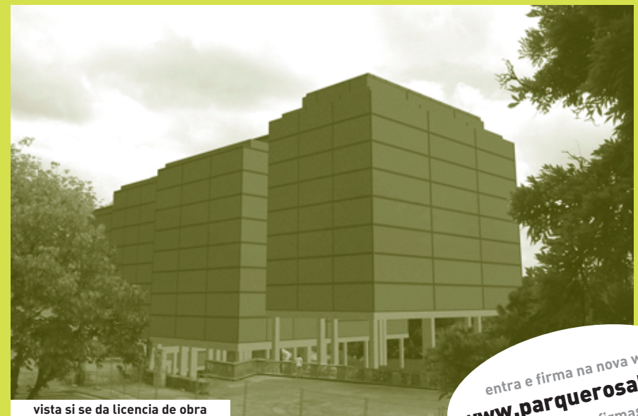
vista si se da licencia de obra

entra e firma na nova web www.parquerosalia.es + de 11.000 firmas