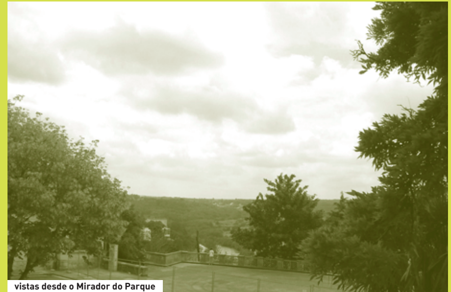
vistas desde o Mirador do Parque